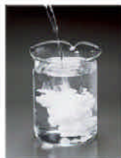
Aceites básicos altamente refinados y emulgadores de gran calidad permiten una óptima mezcla con el agua.

Contiene un 95% de aceite básico y un 5% de emulgadores. Este alto contenido de emulgadores le permite formar una emulsión altamente estable con el agua, pudiendo ser empleado con equipos manuales, o bien, con equipos que no cuenten con sistema de agitación.